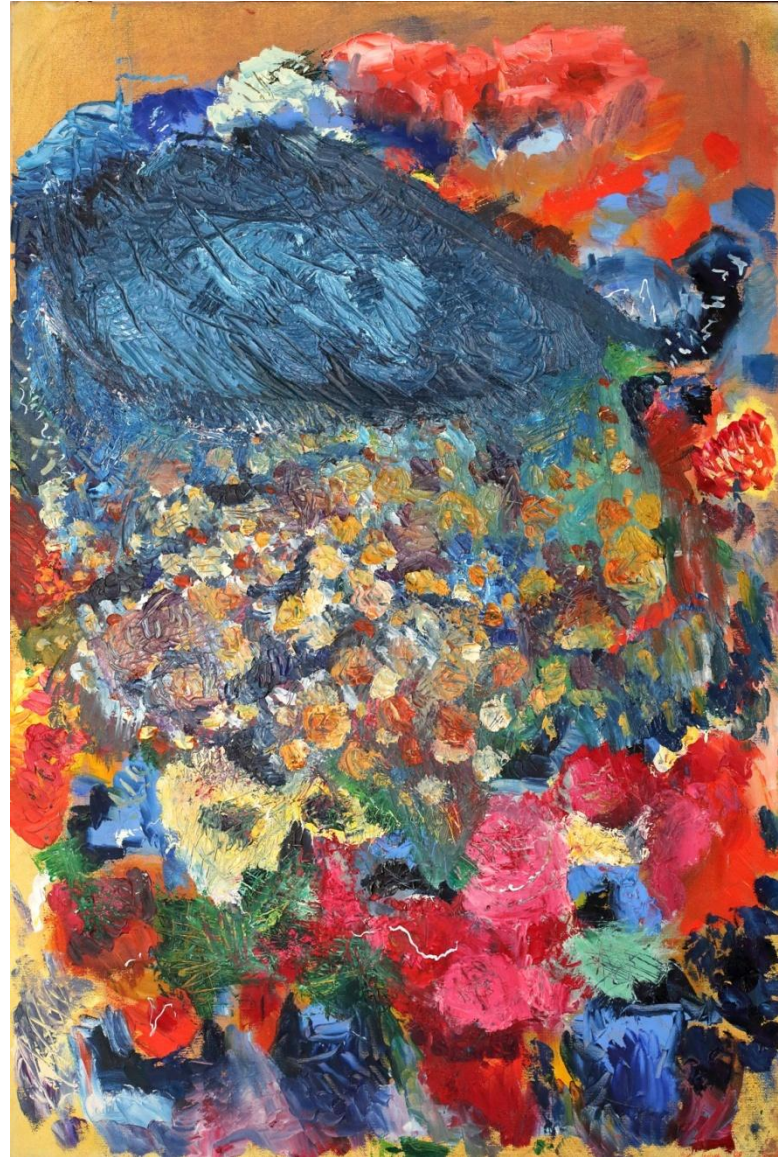
Opera: Fiori su vulcano

Nei dipinti a olio l'artista con l'abrasione tira via materia per rendere più leggero il quadro, per farlo respirare e nello stesso tempo per offrire opere più leggibili e godibili. In alcune opere vengono utilizzate tecniche miste con aggiunte di gesso quando le cromie sono troppo piatte e serve matericità.