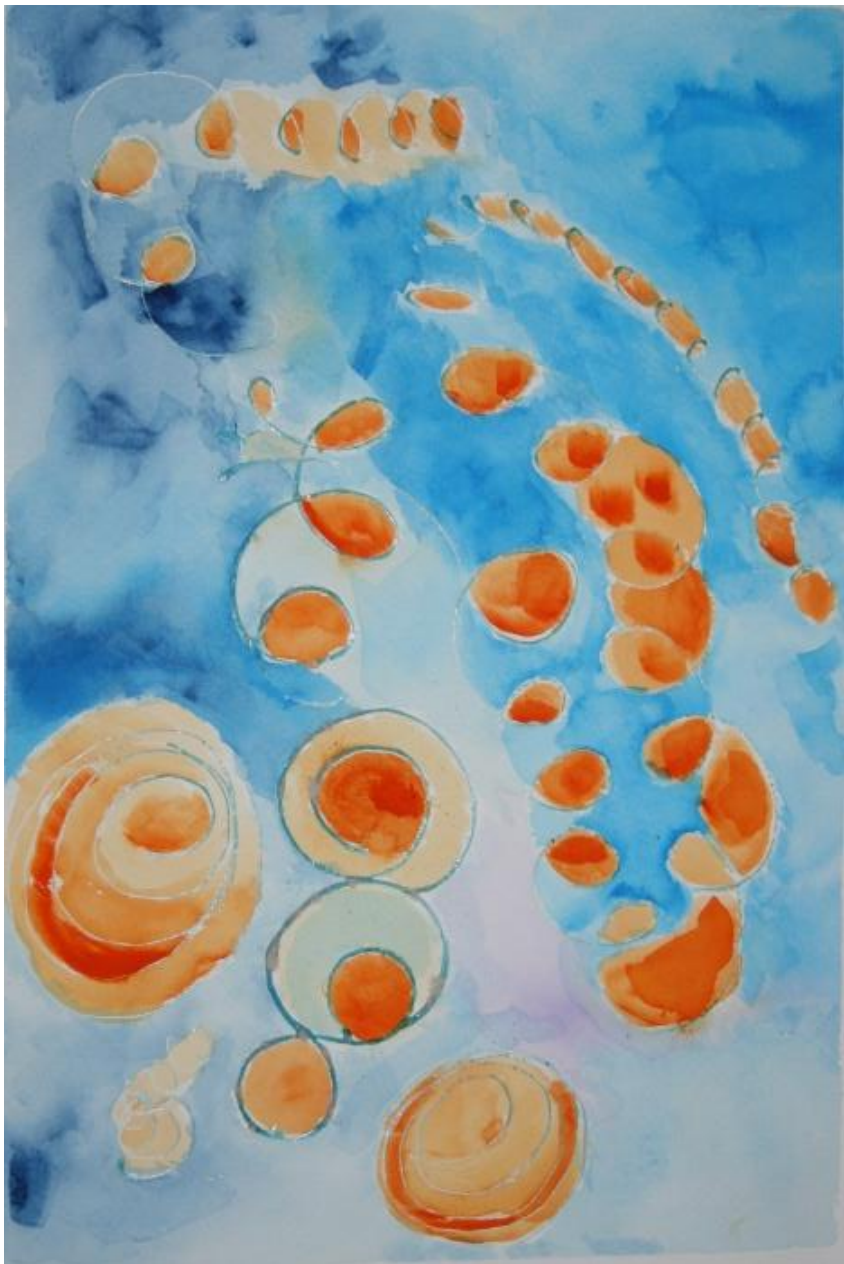
Opera: Palloncini in festa