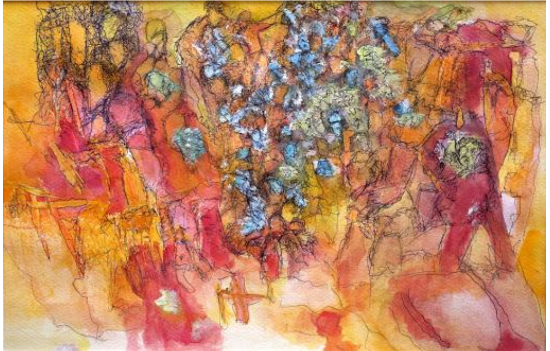
Folla nella festa

Gli acquarelli più recenti hanno colori vivaci in quanto nelle ultime opere Luca Grippa ha usato in alcune parti il tratto nero di china, che ne esalta il colore. Il segno nero mette in evidenza anche delle forme che erano latenti nelle prime fasi di realizzazione dell'opera.