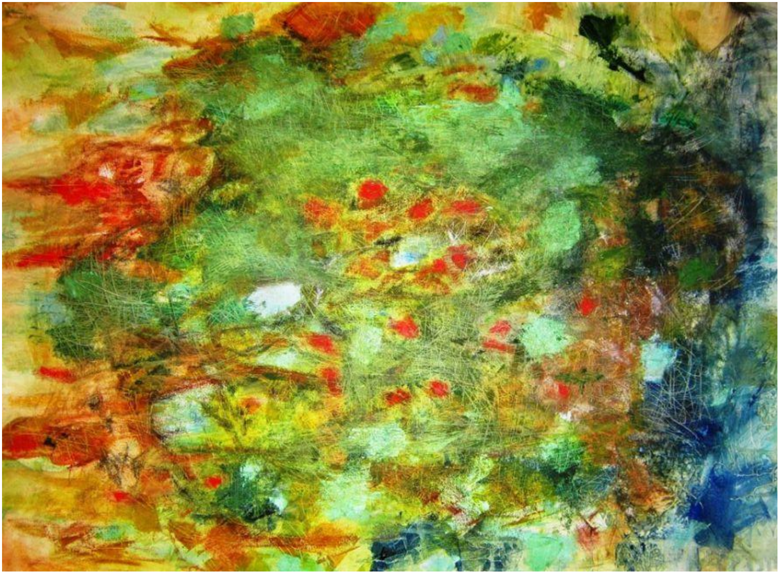
Il mio bosco