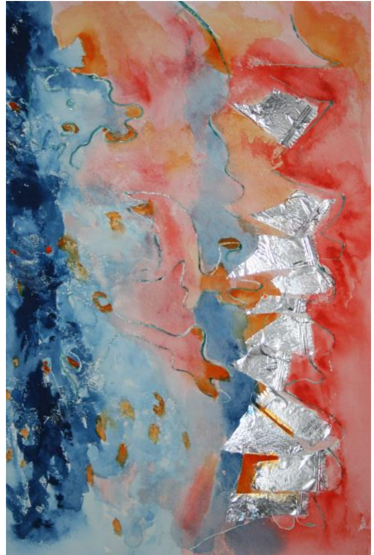
Energia dal mare

L'artista è in continua ricerca per i suoi quadri; alcuni son frutti di un parto difficilissimo, altri che non lo soddisfano cerca sempre di rimetterci mano così da raggiungere quell'istante ideale in cui (secondo lui) l'opera è completa e finita in modo corretto.